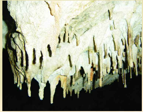
Fósiles estalactitas cuelgan de la bóveda.

el Barranco de Cuartún. Tras recorrer por éste unos 20 minutos, localizaremos a la derecha, bajo un pequeño cortado, la amplia boca de la cavidad, justo antes de que el barranco se abra ante un pinar.