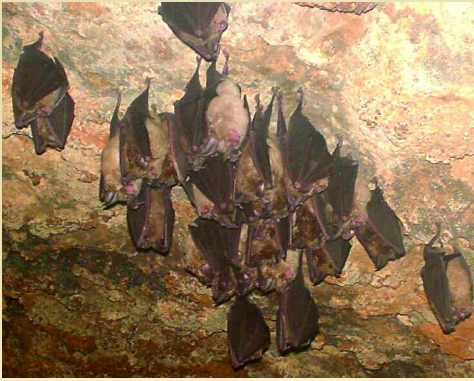
Rhinolophus ferrumeginum en salita final.