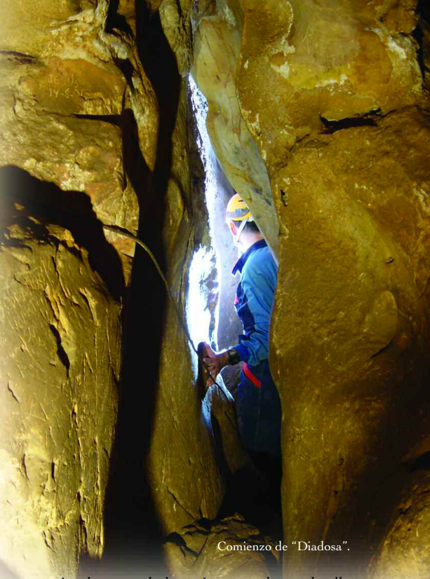
Comienzo de "Diadosa".

ocupación humana de las primeras galerías de ella desde comienzos de la Edad de los Metales