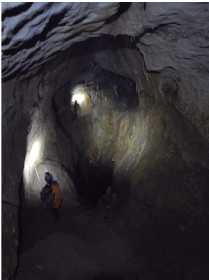
Conducto soplador en Sala de los Lirones (+86m).

otras grandes chimeneas de más de 50 metros, abiertas a mitad de la “Galería de los Gordacos”, la denominada “Pozo del Gran Capitán” y la del “Pozo de la Comba”, que enlaza con el “Laberinto Fantasma” y con el extremo más al sur de la “Galería del Pasamanos Fantasma”. El tercer nivel también se halla en la misma fractura que los otros dos niveles, y lo constituye una galería de dimensiones más reducidas, que con la misma dirección sur asciende hasta quedarse a pocos metros de la superficie, en la cota más alta de la cavidad (+125 m), y muy cercana a la pequeña cavidad llamada “Cueva de los Villanos”.