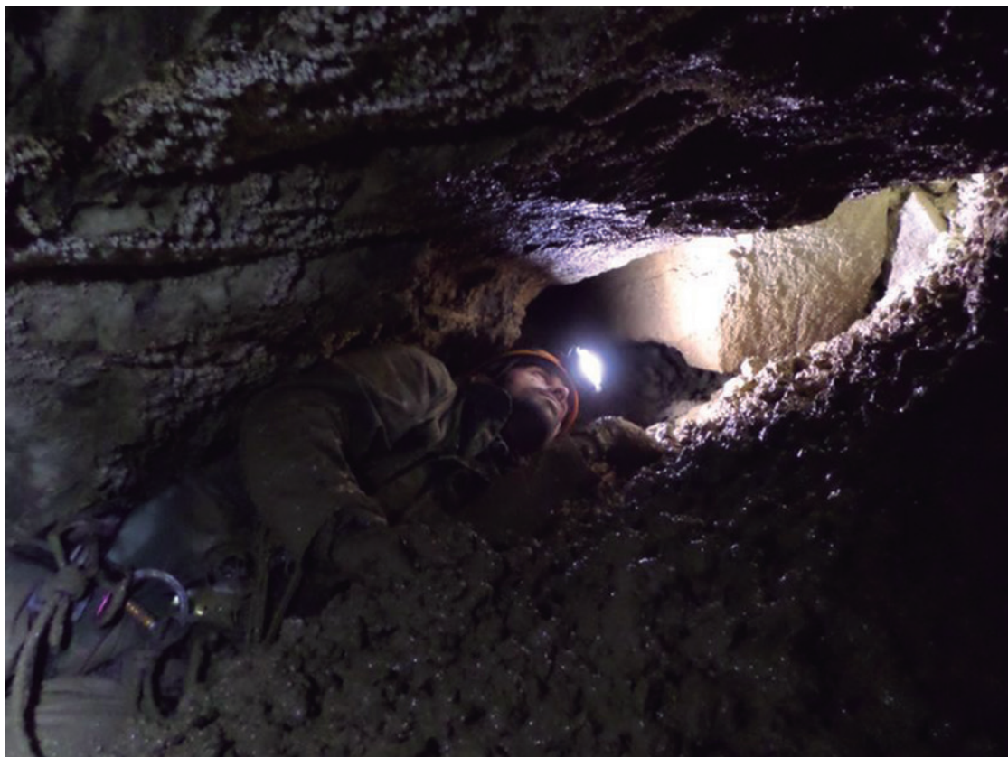
Pasamanos acceso a Galería de los Gordacos (+20m).