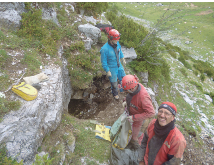
Arriba: boca de entrada. Abajo: Situación de la cavidad en ortofotografía.