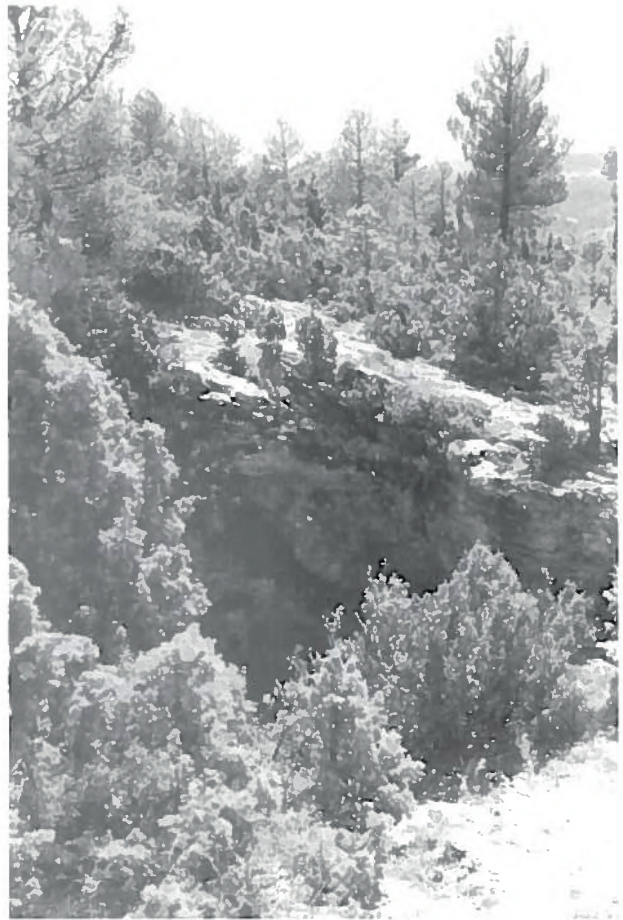
Boca de la sima.