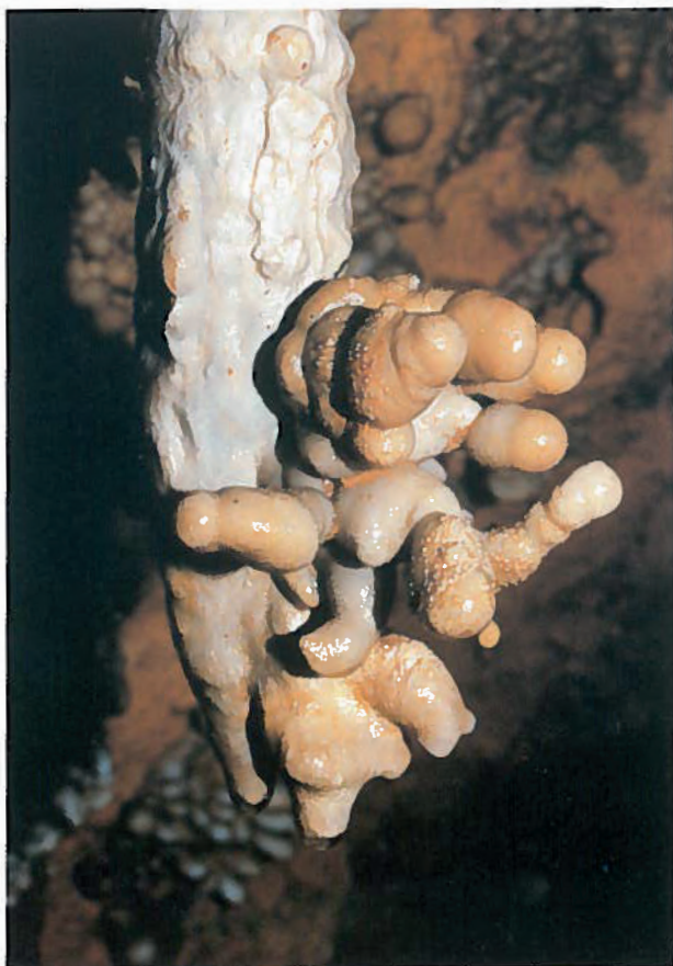
Detalle de una curiosa formación de la cavidad.

Las dos galerías están comunicadas unos metros más abajo. De estas dos galerías, la primera es la que alcanza la cota -114 m., obstruyéndose en el fondo. Ascendiendo una acusada rampa, llegaremos a una enorme sala, de gran altura, de la que parten