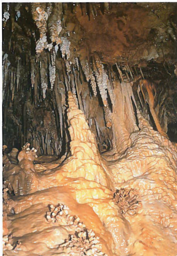
Formaciones en el ramal Este.

pocetes hacia niveles inferiores, entre bloques y derrubios, que actualmente están en exploración.