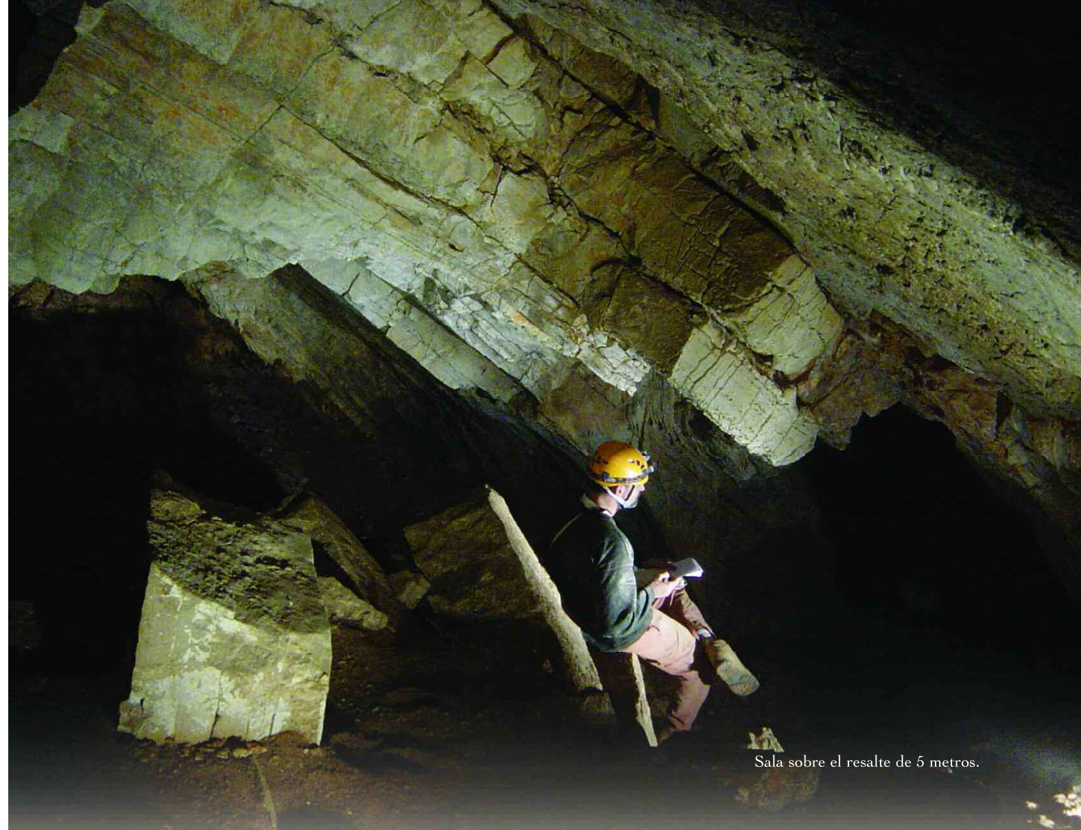
Sala sobre el resalte de 5 metros.

buen estado, atravesando varios desvíos –seguir las indicaciones del mapa de situación–, hasta una paridera donde estacionaremos el vehículo. Desde este punto, siguiendo las trazas de un camino de labranza, bajaremos por la ladera al fondo del Barranco de la Olsa. Descenderemos este bonito