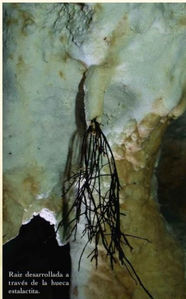
Raiz desarrollada a través de la hueca estalactita.