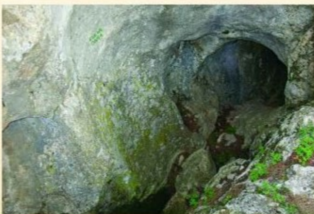
Boca de la cueva.