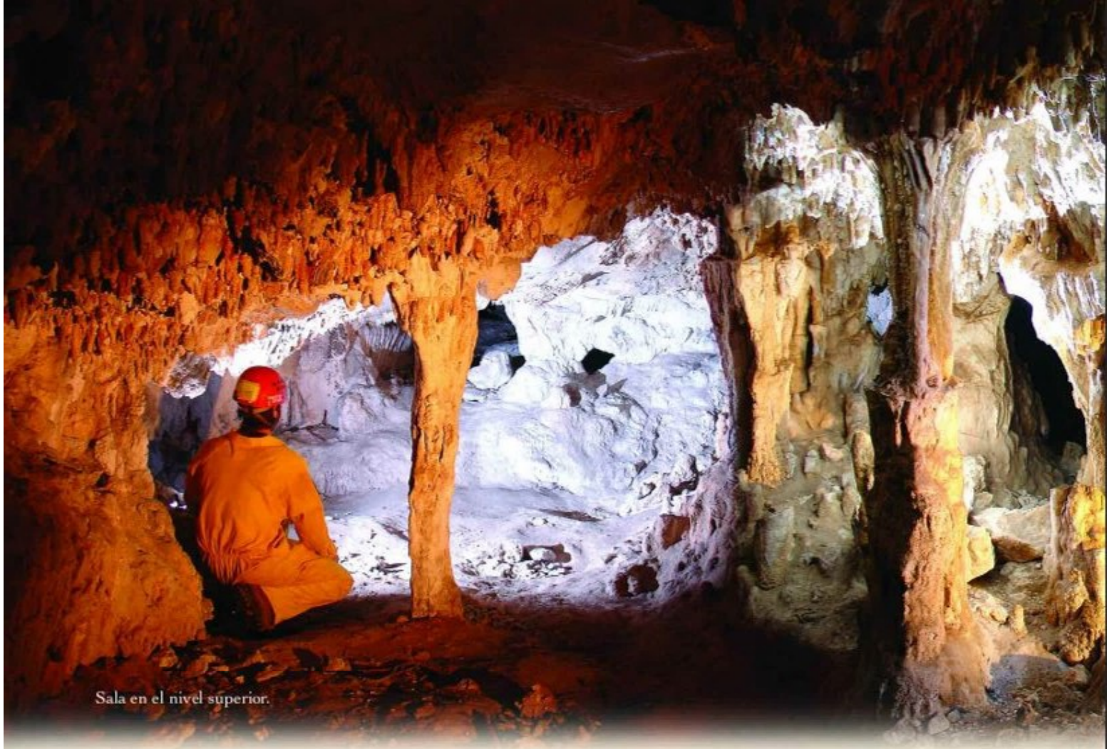
Sala en el nivel superior.